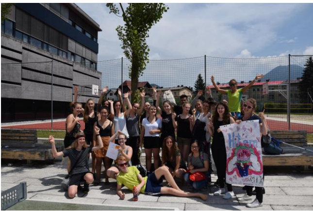
aktivste Klasse, 2 AHGK